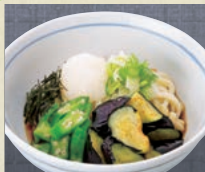
揚げなすおろし 1,046円 (税込1,150円)