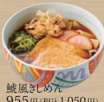
鯪風きしめん 955円 (税込1,050円)