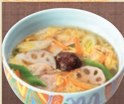
五目 946円 (税込1,040円)