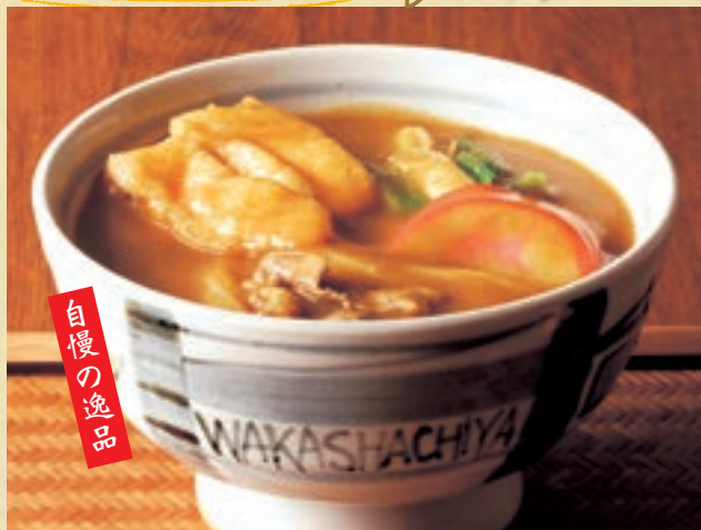
名物カレーうどん・きしめん 1,137円 (税込1,250円)