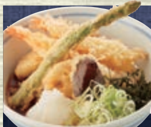
えびおろし (冷) 1,400円 (税込1,540円)