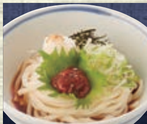
梅じそおろし 946円 (税込1,040円)