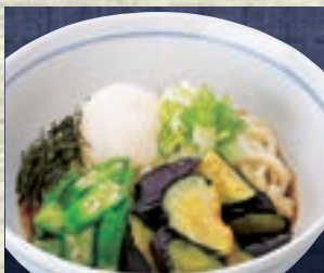
揚げなすおろし 1,046円 (税込1,150円)