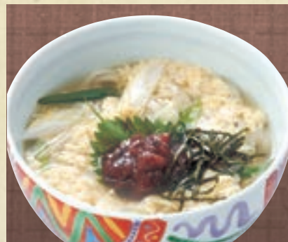
梅とじ 946円 (税込1,040円)