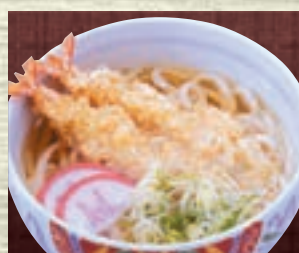
天ぷら 1,091円 (税込1,200円)