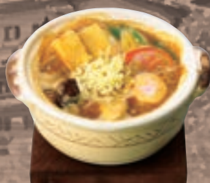
味噌煮込うどん + チーズ 1,637円 (税込1,800円)