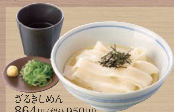
ざるきしめん 864円 (税込950円)