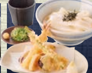
天ざる 1,400円 (税込1,540円) ざる 864円 (税込950円)