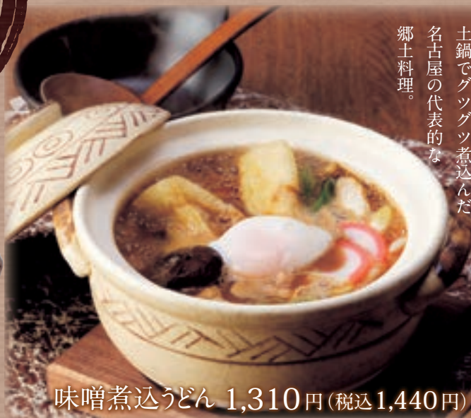
味噌煮込うどん 1,310円 (税込1,440円) 油揚げの増量 (2切) 91円 (税込100円)

堅めの麺の食感と八丁味噌の風味が独特。 土鍋でグツグツ煮込んだ 名古屋の代表的な 郷土料理。