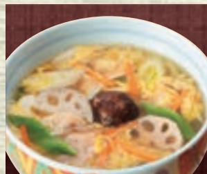
五目 946円 (税込1,040円)