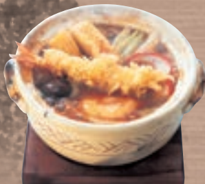
味噌煮込うどん + えび天ぷら (1本) 1,619円 (税込1,780円)