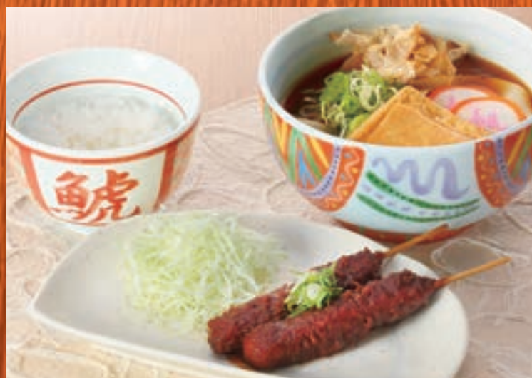
若鯨〈わかしゃち〉セット 1,455円(税込1,600円) 〈鯨風きしめん、味噌串カツ、御飯〉

麺の大盛219円(税込240円) 増 ※ミニ麺を除く / 御飯の大盛137円(税込150円) 増 / 油揚げの増量(2切)91円(税込100円)