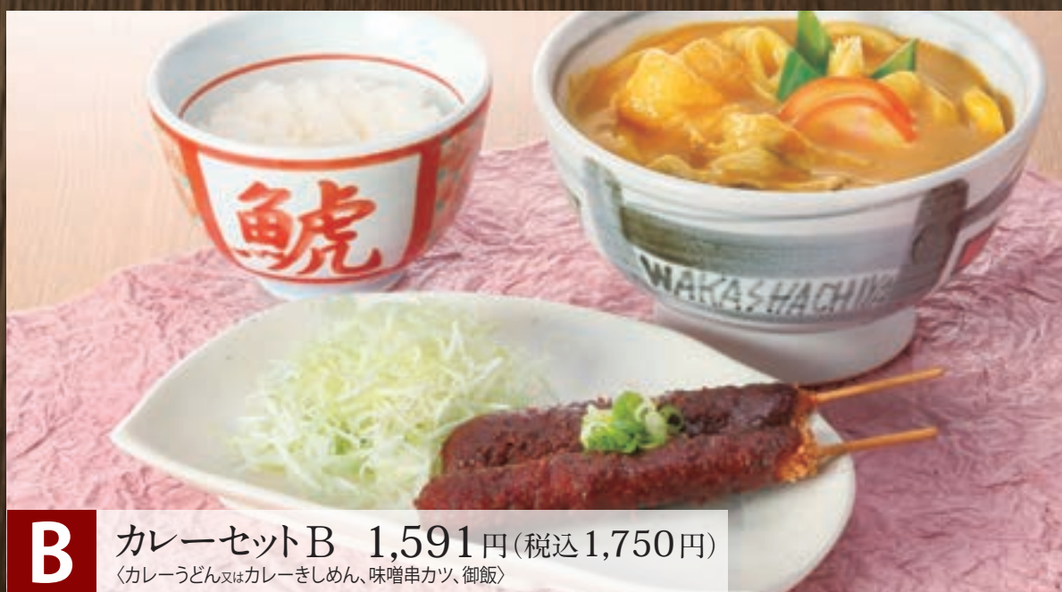
B カレーセットB 1,591円(税込1,750円) 〈カレーうどん又はカレーきしめん、味噌串カツ、御飯〉

麺の大盛219円(税込240円) 増 ※ミニ麺を除く / 御飯の大盛137円(税込150円) 増 / 油揚げの増量(2切)91円(税込100円)