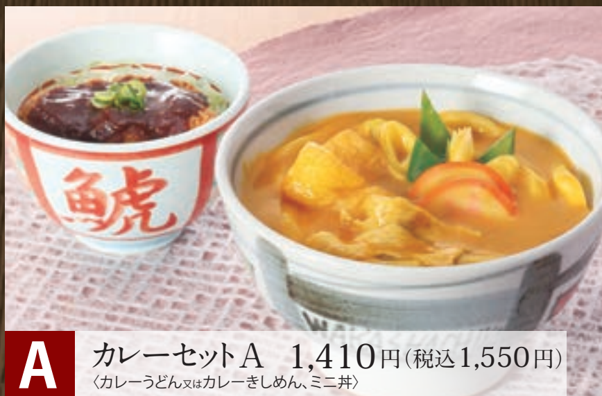
A カレーセットA 1,410円(税込1,550円) 〈カレーうどん又はカレーきしめん、ミニ丼〉