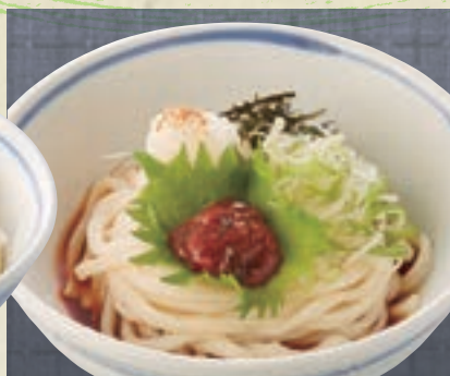
梅じそおろし 946円 (税込1,040円)