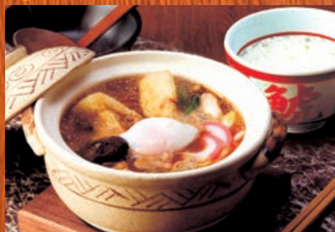
味噌煮込セット 1,455円(税込1,600円) 〈味噌煮込うどん、御飯〉 えび天ぷら味噌煮込セット 1,755円 〈味噌煮込うどん、えび天ぷら(1本)、御飯〉 (税込1,930円)