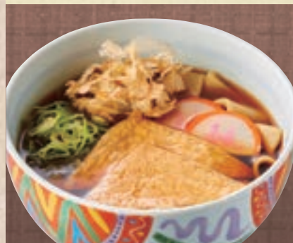
鰯風きしめん 955円 (税込1,050円)