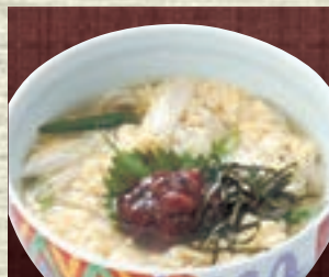
梅とじ 946円 (税込1,040円)