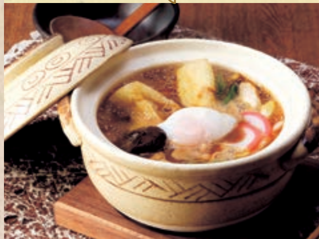
味噌煮込うどん 1,310円 (税込1,440円)