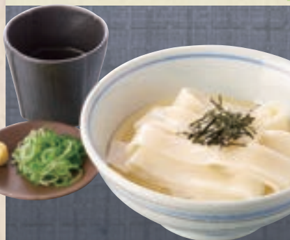
ざる 864円 (税込950円)