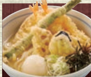
えびおろし (温) 1,400円 (税込1,540円)