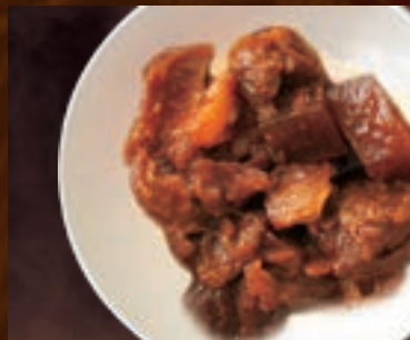
牛すじと味噌煮 300円(税込330円)