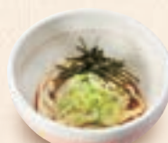
ミニ冷たいうどん ミニ冷たいそば