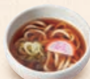
ミニ温かいうどん ミニ温かいそば