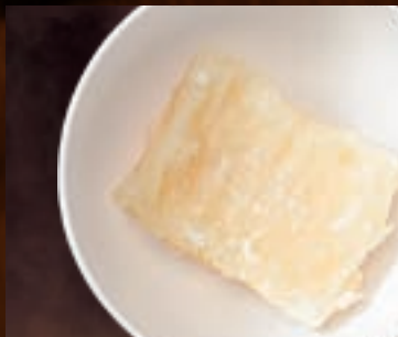
揚げもち 219円(税込240円)