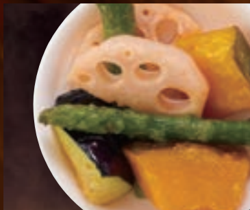
ゴロゴロ野菜 382円(税込420円)