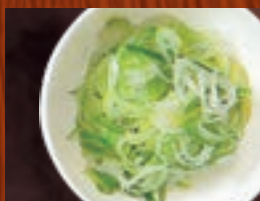
山盛り刻みねぎ 237円(税込260円)