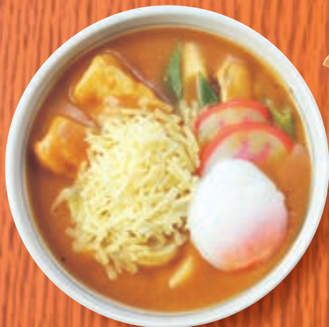
カレーうどん + 温玉 + チーズ 1,491円(税込1,640円)