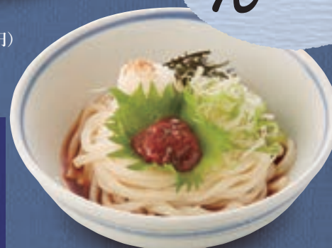
梅じそおろし 846円(税込930円)