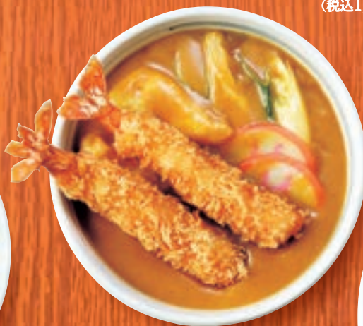
カレーうどん + えびフライ(2本) 1,782円 (税込1,960円)