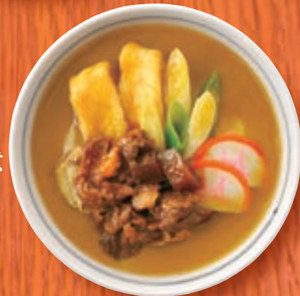
カレーうどん + 牛すじ どて味噌煮 1,319円 (税込1,450円)