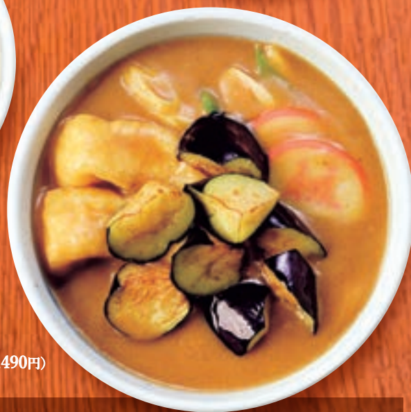
カレーうどん + 揚げなす 1,355円(税込1,490円)