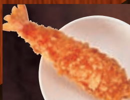
えびフライ(1本) 382円(税込420円)