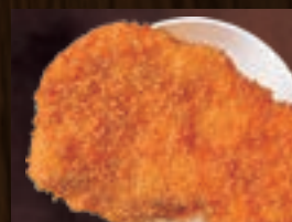
ロースカツ 473円(税込520円)