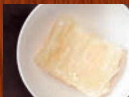
揚げもち 219円(税込240円)