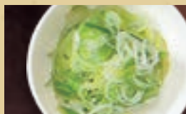
山盛り刻みねぎ 237円(税込260円)