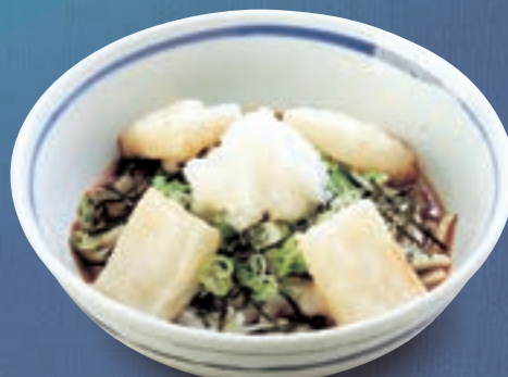
揚げもちおろし 891円(税込980円)