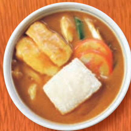
カレーうどん + 揚げもち 1,237円 (税込1,360円)