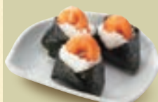
天むす(3個) 500円(税込550円)