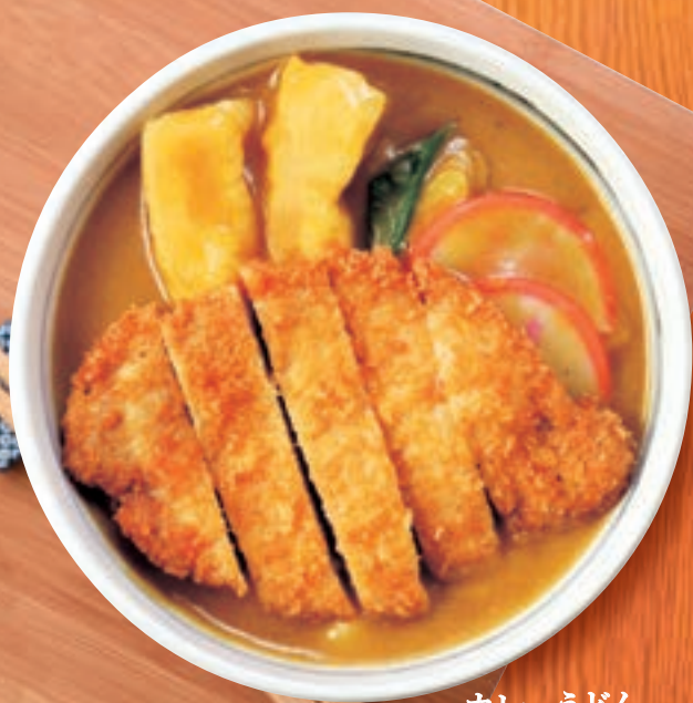
カレーうどん + ロースカツ 1,491円(税込1,640円)