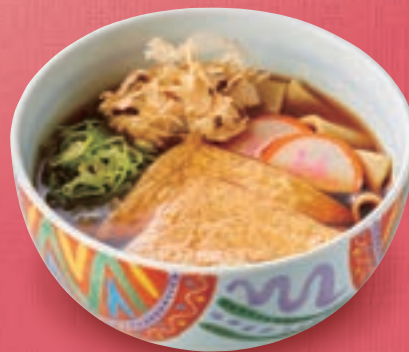
鯪風きしめん(温) 864円(税込950円)