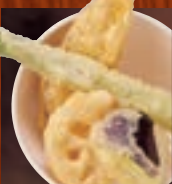
野菜天ぷら 355円(税込390円)