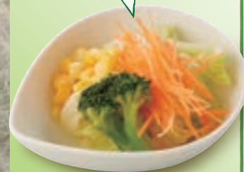
プチベジサラダ 237円(税込260円)

最初に野菜を食べることで 血糖値の急な上昇を防ぎ 脂質の吸収を抑えてくれる 効果があります。