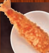
えびフライ(1本) 382円(税込420円)