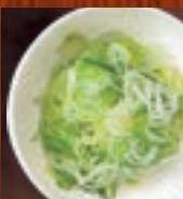
山盛り刻みねぎ 237円(税込260円)