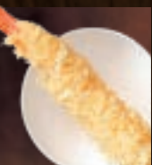
大えび天ぷら(1本) 591円(税込650円)