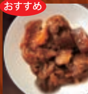
牛すじで味噌煮 300円(税込330円)