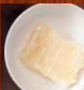
揚げもち 219円(税込240円)