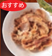
牛肉甘辛煮 346円(税込380円)