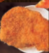
ロースカツ 473円(税込520円)