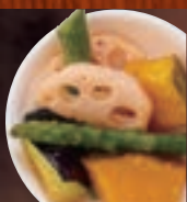
グログロ野菜 382円(税込420円)