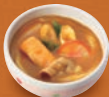
ミニカレーうどん/ きしめん