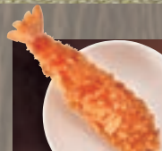
えびフライ(1本) 371円 (税込 400円)