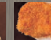
ロースカツ 445円 (税込 480円)