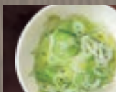
山盛り刻みねぎ 213円 (税込 230円)