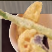
野菜天ぷら 334円 (税込 360円)