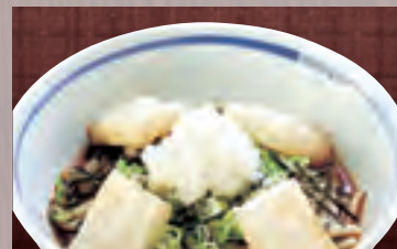
揚げもちおろし 973円(税込1,050円)

ころ 797円(税込860円) 鯉風きしめん(冷) 945円(税込1,020円)