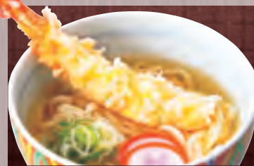
大えび天ぷら 1,473円(税込1,590円)

かけ 797円(税込860円) 玉子とじ 825円(税込890円) 梅とじ 926円(税込1,000円) 五目 926円(税込1,000円)