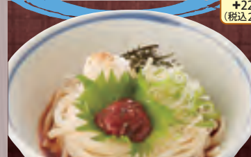
梅じそおろし 926円(税込1,000円)