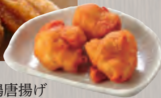
鶏唐揚げ 528円(税込570円)