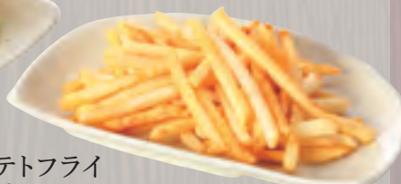
ポテトフライ 556円(税込600円)