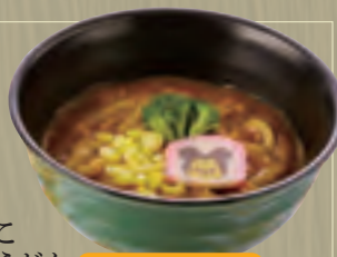
ちびっこ カレーうどん ジュース・おもちゃ付 889円(税込960円)