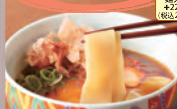
鯉風きしめん(温) 945円(税込1,020円)