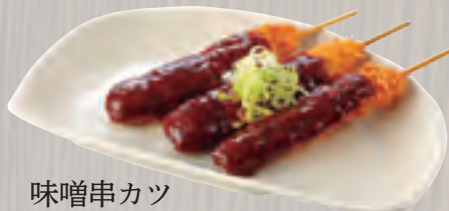
味噌串カツ (3本)723円 (税込780円)