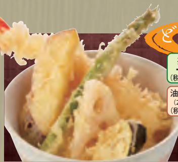
大えびと野菜の天丼

単品 1,149円(税込1,240円) ミニ麺セット 1,584円(税込1,710円)