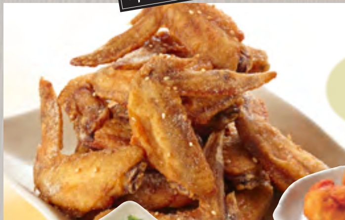
手羽先 (5本) 862円 (税込930円)