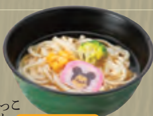
ちびっこ うどん ジュース・おもちゃ付 760円(税込820円)