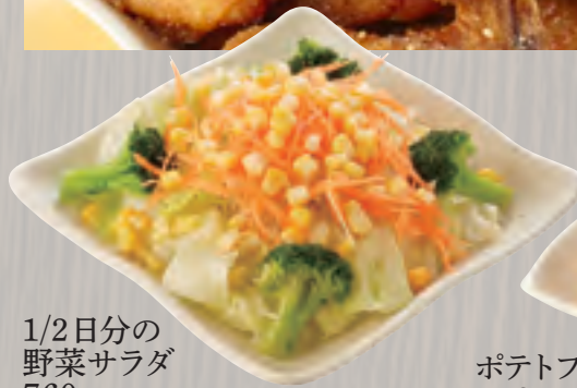
1/2日分の 野菜サラダ 760円(税込820円)