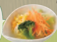
プチベジサラダ 260円(税込280円)

まずは 野菜を食べよう！ 血糖値の急な上昇を防ぎ 脂質の吸収を抑えてくれる 効果があります。